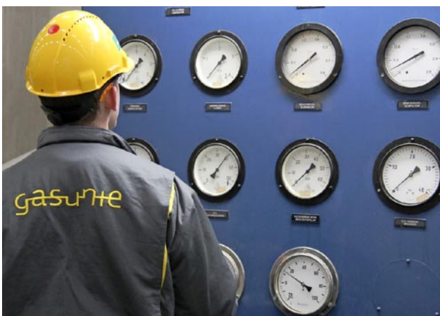
Zodra de rode stip op de helm helemaal wit is, moet de helm vervangen worden.