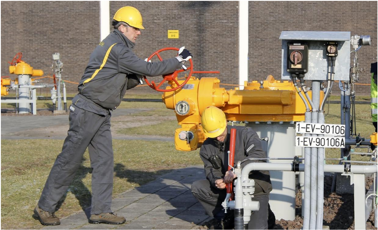
Van der Velden: 'Mensen stappen na werktijd met die bril op de fiets.'